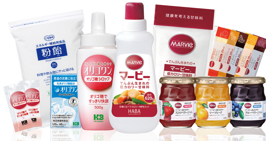
取扱い商品イメージ

当社は2021年3月30日をもって、関連子会社の株式会社HプラスBライフサイエンスを吸収合併。半世紀の長きにわたり、低カロリー甘味料「マービー」をはじめ、多くの医療機関や高齢者施設などで取扱われてきた食品を、当社の通信販売や直営店(一部店舗、一部商品を除く)でも販売する事になりました。