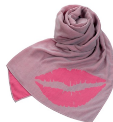
【オリジナルストール】