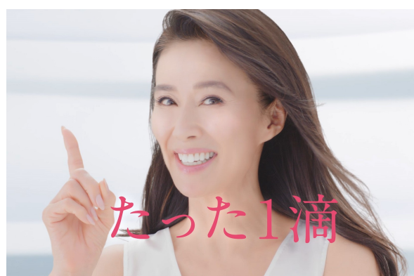
『スクワラン ビッグボトル篇』