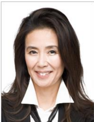
萬田 久子 (まんだ ひさこ) さん

1958年大阪生まれ。'78年ミスユニバース日本代表に選ばれ、'80年にNHK連続テレビ小説『なっちゃん』の写真館』で女優デビュー。以降、テレビ、映画、舞台などで幅広く活躍中。'92年9月よりハーバーのイメージキャラクターを務め、今年で31年目。映画「鳩のごとく蛇のごとく斜陽」(11月4日より公開)に出演。