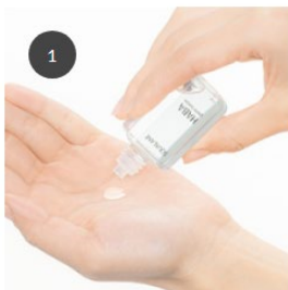
1 手のひらに化粧水の水滴がある状態で、スクワランを1滴。