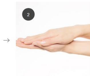
2 顔全体に使えるように、手のひらでしっかりとのぼす。