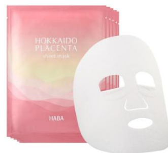
『北のプラセンタ シートマスク』 2,860円(税込)

『北のプラセンタ シートマスク』はエイジングケア※ 2 に着目し、北海道産サーモンのマリンプラセンタ®エキス※ 3 を贅沢に配合。マリンプラセンタ®には、美肌に良いとされているアミノ酸が豊富に含まれており、肌にハリ・つや・うるおいを与えます。さらに、ビタミンCやフラボノイドを多く含むハマナス花エキス、ビタミンやミネラルを多く含むハスカップエキスを配合。ストレッチ素材のマスクが肌にしっかり密着し、北海道の恵みをたっぷり肌に届け、うるおいに満ちたハリとつやのある肌に導きます。