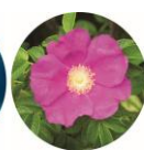
ハマナス花 エキス※ 4