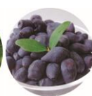
ハスカップ エキス※ 5

※ 1 加齢に伴う変化が現れた肌のこと ※ 2 2年経に応じた保湿、ハリのお手入れ ※ 3 加水分解サケ卵巣膜エキス(皮膚コンディショニング成分): マリンプラセンタ®は、株式会社日本バリアフリーの商標登録です。 ※ 4 保湿成分 ※ 5 ロニセラカエルレア果汁: 保湿成分